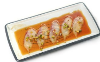
140. Carpaccio suzuki Fettine di branzino in salsa ponzu con granella di pistacchio