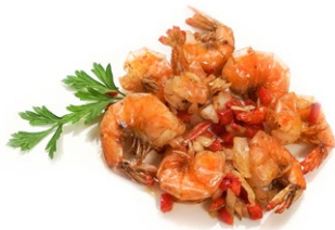
62. Gamberi sale e pepe Gamberi* cipolla