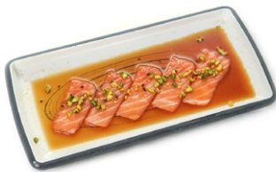
139. Carpaccio sake Fettine di salmone in salsa ponzu con granella di pistacchio