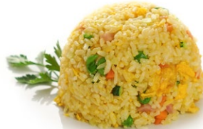
42. Canton rice Riso saltato con uova, piselli, prosciutto e salsa teriyaki .. 5.00 euro 🌱🥚