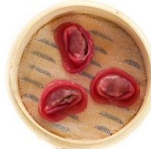
29. Ravioli* di manzo Manzo, salsa di soia, olio di sesamo e barbabietola (3pz)