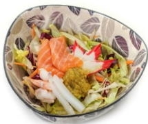
37. Kaisen salad Insalata mista con salmone, surimi*, calamari* e gamberi*