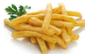
92. Patatine fritte* Patine fritte