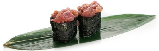
198. Spicy maguro Tonno e piccante .. 5.00 euro 🐟