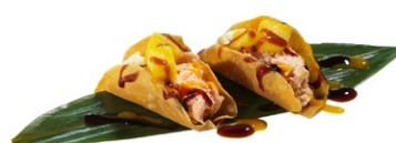
17. Tacos miu Fogli di farina, salmone cotto, philadelphia e teriyaki (2pz)