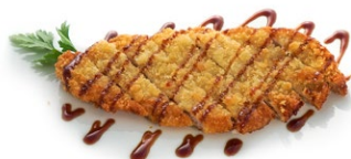
94. Cotoletta Cotoletta di maiale