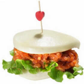
32. Gua bao sake Insalata, tartare di salmone e teriyaki