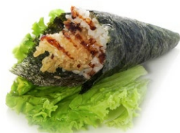
183. Ebiten Ebi* tempura, avocado e philadephia