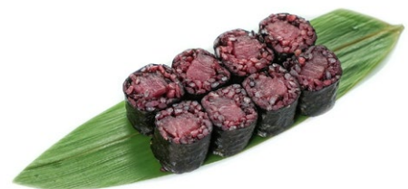
214. Hosomaki black maguro Tonno