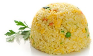
46. Yasai rice Riso saltato con verdure miste e uova .. 5.00 euro 🌱🥚