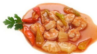
67. Gamberi in agrodolce Gamberi* con zucchine, carote e peperoni