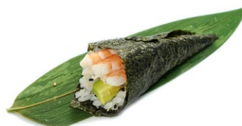
182. Ebi Gambero* cotto, avocado e maionese