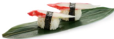
169. Nigiri kani Surimi*