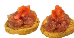
21. Cracker maguro Pane fritto, tartare di tonno e pomodorino