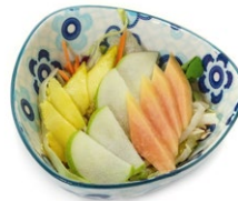
39. Fruits salad Insalata mista con frutta fresca