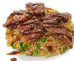
48. Riso con manzo Riso saltato con manzo in salsa sate', verdure miste e uova .. 7.00 euro 🌱🥚