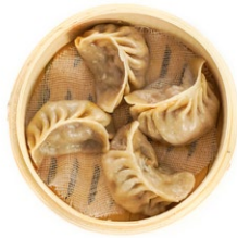
22. Gyoza Ravioli* ripieni di maiale al vapore