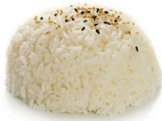
41. Gohan Riso bianco con sesamo .. 3.00 euro 🌱