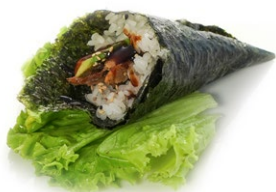
181. Unaghi Anguilla* e salsa teriyaki