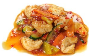
71. Pollo piccante Zucchine, carote, peperoni