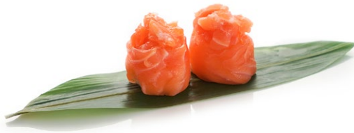
195. Sake Tartare di salmone .. 6.00 euro 🐟