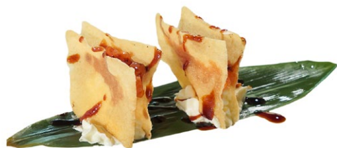
13. Mille foglie di sake Fogli di farina, tartare di salmone, philadelphia e teriyaki