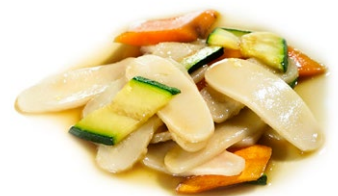
49. Gnocchi di riso Gnocchi di riso con zucchine e carote .. 7.00 euro 🌱🥬