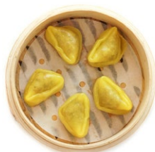
28. Ravioli* di totano Totano, zafferano e olio di sesamo (3pz)