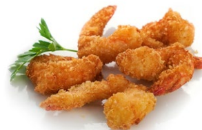
89. Ebi fritto Gamberi* fritti