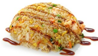
45. Riso con gamberi Riso saltato con gamberi*, uova, carote, zucchine e salsa teriyaki .. 7.00 euro 🌱🥚🦞