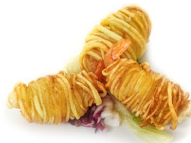
91. Ebiten fritto Gamberi* fritti con patate all'esterno