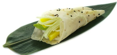
190. Vegetariano Foglio di soia kappa, avocado e rapa gialla .. 4.50 euro 🌿🥑