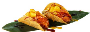
15. Tacos sake Fogli di farina, salmone, mango, philadelphia e salsa teriyaki (2pz)