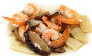
66. Gamberi* funghi e bambu Bambu e funghi