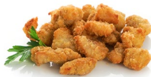
88. Tory fritto Pollo fritto