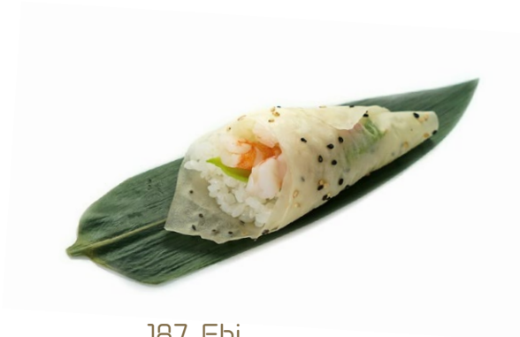
187. Ebi Foglio di soia gambero* cotto, avocado e maionese .. 5.00 euro 🌿🥑🍤🍷