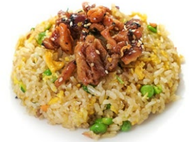
43. Chicken rice Riso saltato con pollo e verdure miste in salsa teriyaki .. 7.00 euro 🌱🥚