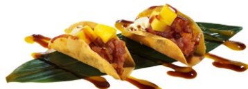
16. Tacos tuna Fogli di farina, tonno, mango, philadelphia e salsa teriyaki (2pz)