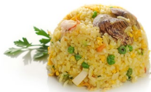
44. Seafood rice Riso saltato con frutti di mare*, uova, carote, zucchine e salsa teriyaki .. 8.00 euro 🌱🥚🦞🦐