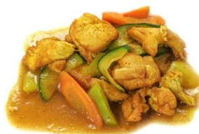
72. Pollo al curry Zucchine, carote e salsa curry