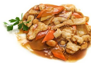
73. Pollo alle mandorle Carote, zucchine e mandorle