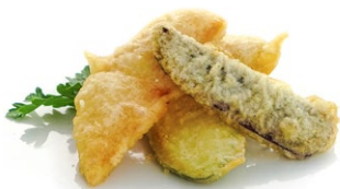
87. Tempura yasai Verdure miste fritte in pastella di tempura