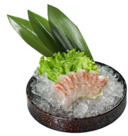
138. Suzuki sashimi Fettine di branzino crudo (6pz)