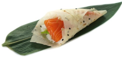
185. Sake Foglio di soia, avocado e salmone .. 5.00 euro 🌿🥑🐟