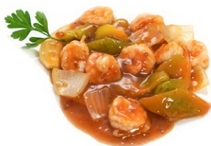
65. Gamberi piccanti Gamberi* con zucchine, carote e peperoni