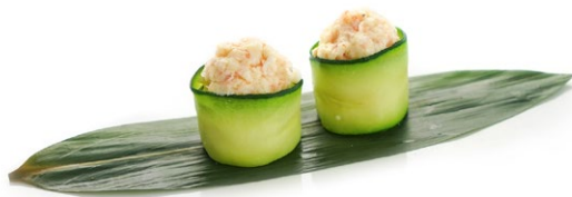
201. Ebi Zucchine e tartare di gambero* cotto .. 5.00 euro 🐟 🍳