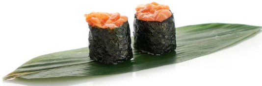
197. Spicy sake Salmone e piccante .. 5.00 euro 🐟