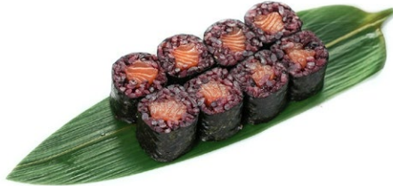
213. Hosomaki black sake Salmone