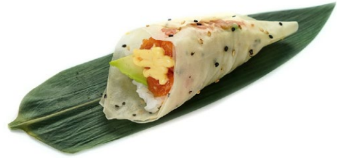
186. Spicy salmone Foglio di soia, tartare di salmone, avocado e salsa piccante .. 5.50 euro 🌿🥑🐟