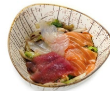
40. Insalata calda Insalata mista cotta con pesce misto crude in salsa ponzu