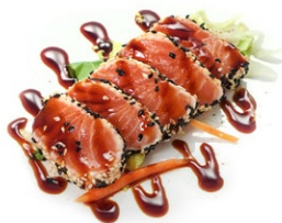
141. Sake tataki Salmone scottato, sesamo in salsa tataki e peperoncino