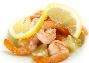
68. Gamberi al limone Gamberi* con limone