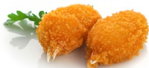
93. Chele di granchio Chele di granchio* fritto (2pz)