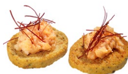
20. Cracker ebi Pane fritto e gambero* cotto in salsa rosa