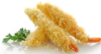
86. Tempura ebi Gamberoni* fritti in pastella di tempura