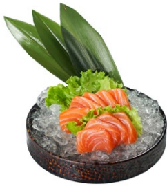
136. Sake sashimi Fettine di salmone crudo