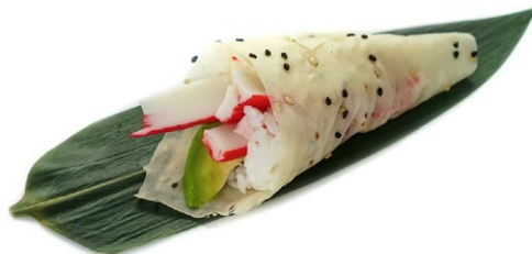
189. California Foglio di soia, surimi*, avocado e maionese .. 5.00 euro 🌿🍷🍤🍷