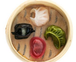
31. Dim sum mix Ravioli* misti (3pz)