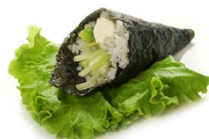
184. Vegetariano Kappa, avocado e rapa gialla