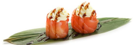
200. Chizu Salmone, philadelphia e teriyaki .. 5.00 euro 🐟 🥛 🌿