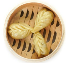
24. Yasai gyoza Ravioli* di verdure al vapore