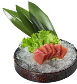
137. Maguro sashimi Fettine di tonno crudo (6pz)