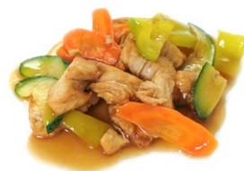
70. Pollo alle verdure Zucchine e carote