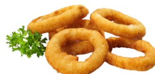
95. Anelli di cipolla