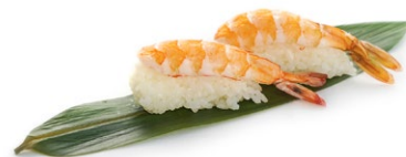
170. Nigiri ebi Gambero* cotto