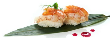
173. Nigiri amaebi Gambero* crudo