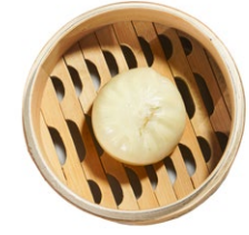
27. Bao Bao* bianco ripieno di maiale al vapore