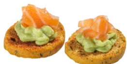
18. Cracker avocado Pane fritto, tartare di salmone con crema di avocado