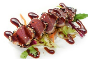
142. Tonno tataki Tonno scottato, sesamo in salsa tataki e peperoncino