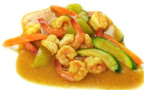
63. Gamberi al curry Gamberi* con zucchine e carote