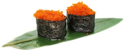
199. Tobiko Tobiko .. 5.00 euro 🐟