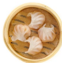
26. Ravioli di gamberi Ravioli* ripieni di gamberi*