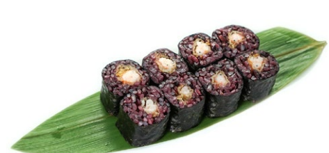
216. Hosomaki black ebiten Gamberoni* fritti