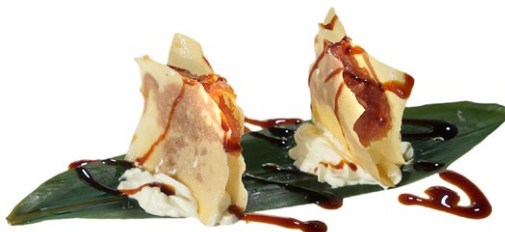
14. Mille foglie di maguro Fogli di farina, tartare di tonno, philadelphia e teriyaki