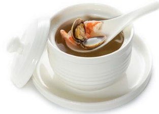
36. Kaisen misoshi Zuppa di miso con misto di mare*, wakame e tofu