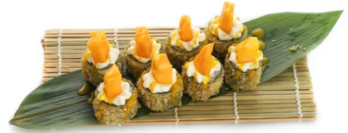
212. Hosomaki mango Salmone, philadelphia, mango e salsa teriyaki