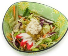
38. Kani salad Insalata mista con polpa di granchio* e surimi*