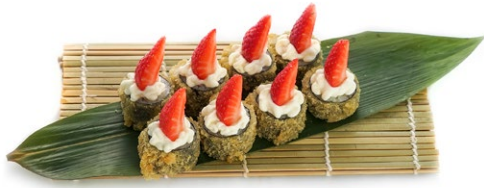
211. Hosomaki fragola Salmone, philadelphia, fragola e salsa teriyaki