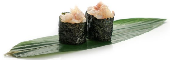
196. Suzuki Branzino .. 5.00 euro 🐟