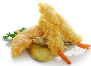
85. Tempura mista Gamberoni* e verdure miste fritte in pastella di tempura