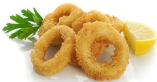
90. Ika fry Anelli di calamari* fritti