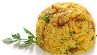
47. Riso al curry Riso saltato con carote, zucchine, curry e uova .. 6.00 euro 🌱🥚