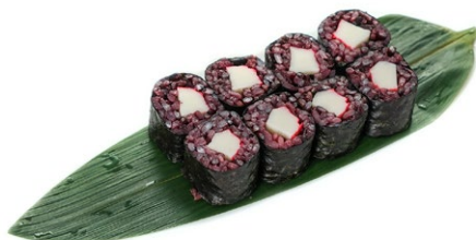
215. Hosomaki black california Surimi*