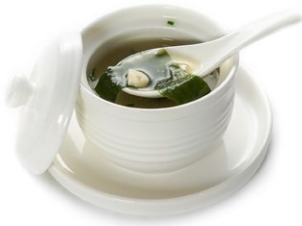
34. Miso shiru Zuppa di miso, tofu, wakame e mais