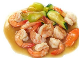
64. Gamberi con verdure Gamberi* con zucchine e carote