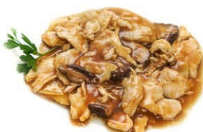
69. Pollo funghi e bambu Bambu e funghi