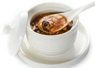
35. Zuppa xiao Agropiccante, tofu, carote, zucchini, funghi, bambu e uovo