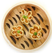
25. Shao mai Ravioli* di maiale gamberi*, verdure al vapore