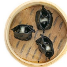
30. Ravioli* di calamari Calamari*, nero di seppia e olio di sesamo (3pz)