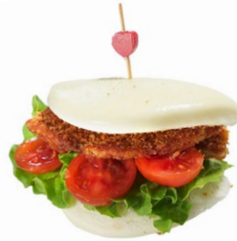
33. Gua bao cotoletta Insalata, cotoletta di maiale, pomodoro e maionese