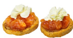
19. Cracker sake Pane fritto, tartare di salmone e philadelphia