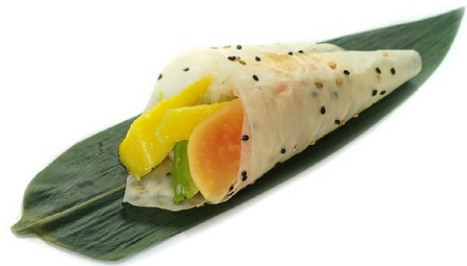
188. Fruit Foglio di soia e frutta .. 4.50 euro 🌿🍌