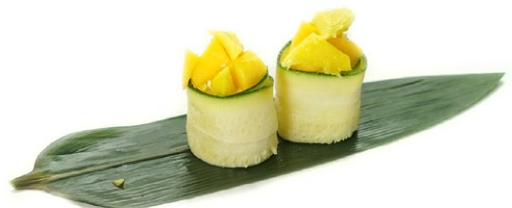
202. Vegetariano Zucchine, cubetti di frutta e philadelphia .. 4.50 euro 🥛